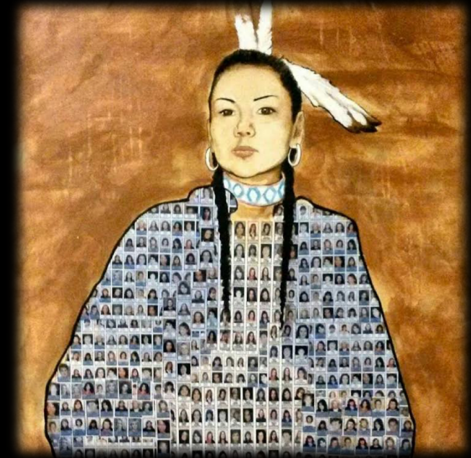
Femmes autochtones disparues et assassinées